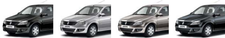
أسود لؤلؤي HNL (ثانوي) PEARL BLACK 676 (SEC) رمادي بلاتينيوم D69 (ثانوي) PLATINUM GREY D69 (SEC) رمادي بازلت KNM (ثانوي) BASALT GREY KNM (SEC) رمادي خمصي KNA (ثانوي) COMET GREY KNA (SEC)

ألوان معدنية (ثانوي) METALLIC COLOURS (SEC)