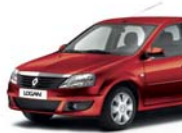
أحمر فاني 21D (أساسي) PASSION RED 21D (GO)

ألوان معدنية (ثانوي) METALLIC COLOURS (SEC)