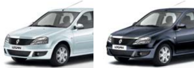
أبيض نقى 369 (أساسي) GLACIER WHITE 369 (GO) أزرق بحري OV 61H (أساسي) MARINE BLUE OV 61H (GO)