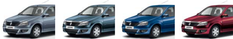
أزرق كهربائي TE RNZ (ثانوي) ELECTRIC BLUE TE RNZ (SEC) أزرق معدني TE RNF (ثانوي) MINERAL BLUE TE RNF (SEC) أزرق نقى TE RNA (ثانوي) EXTREME BLUE TE RNA (SEC) أحمر ناري B76 (ثانوي) FIRE RED B76 (SEC)