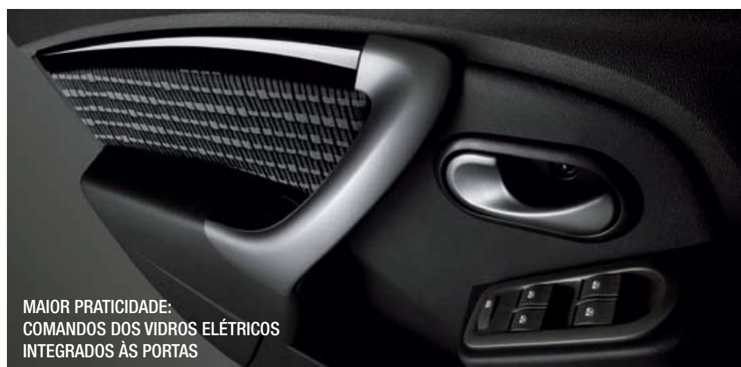
MAIOR PRATICIDADE: COMANDOS DOS VIDROS ELÉTRICOS INTEGRADOS ÀS PORTAS