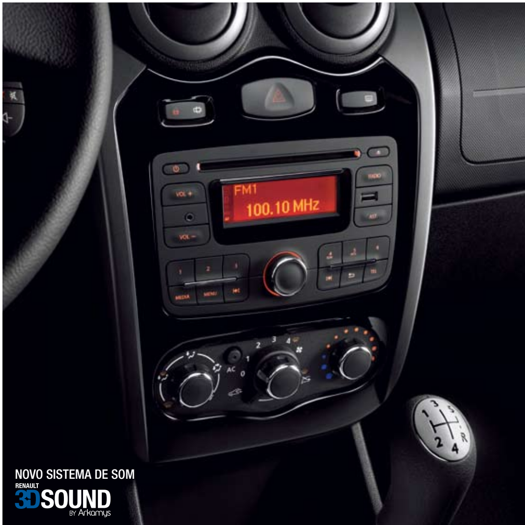
NOVO SISTEMA DE SOM RENAULT 3D SOUND by Arkamys