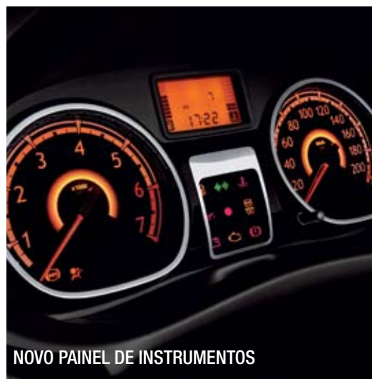
NOVO PAINEL DE INSTRUMENTOS

MAIS CONFORTO E PRAZER DE DIRIGIR E COM FUNÇÃO PARA ARRANCADÁ EM PISOS ESCORREGADIOS.