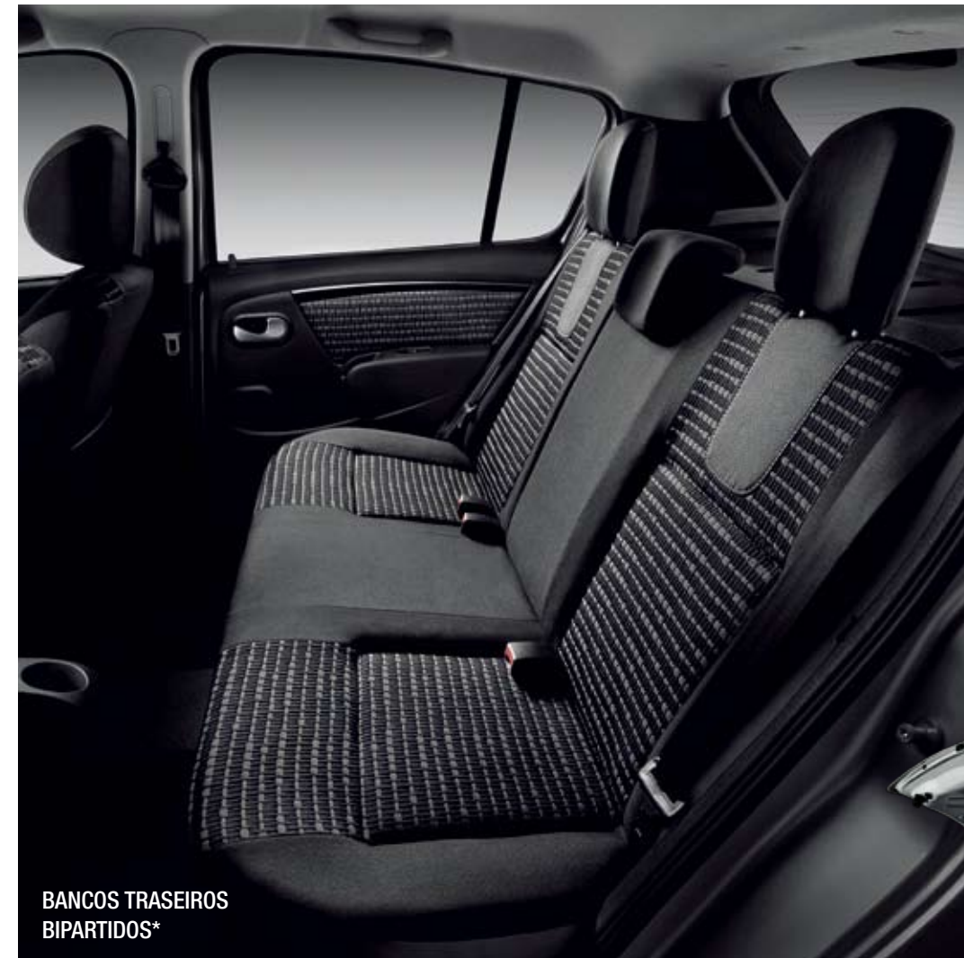
BANCOS TRASEIROS BIPARTIDOS*