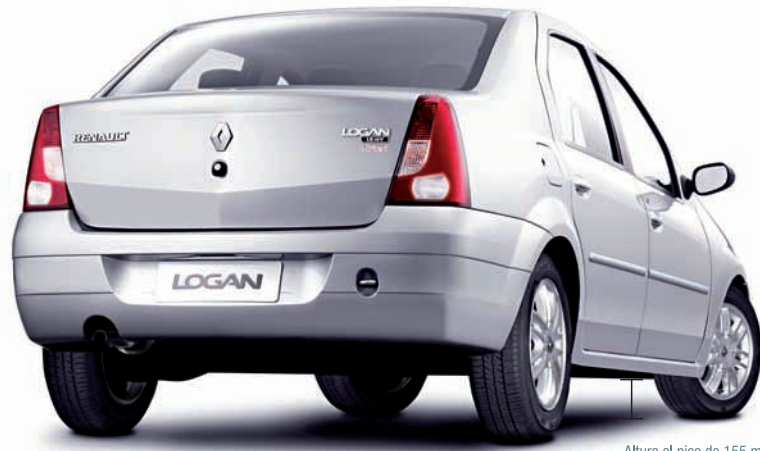
Altura al piso de 155 mm, superior dentro de su categoría