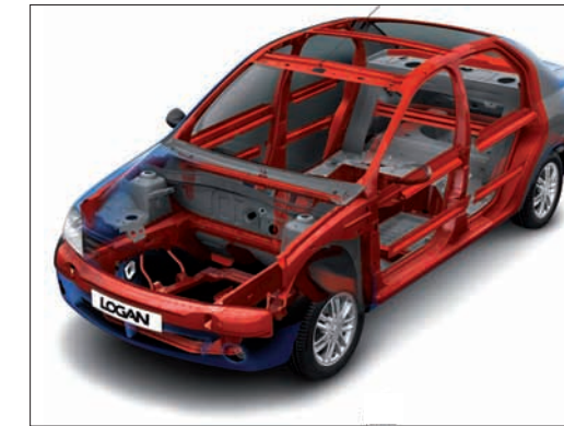
Chasis con zona de deformación programada