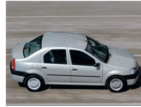
Protege el medio ambiente. El 95% de las piezas son reciclables

La caja de velocidades de cinco marchas asegura relaciones de cambio fáciles y precisas, incrementan el confort de utilización y permiten explotar al máximo el potencial de los motores. En condiciones óptimas de manejo, el rendimiento en ciclo mixto es de 14,5 Km./Lt.