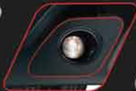
Sticker decorativo de neblineros