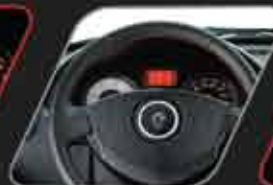
Volante de cuero con costuras rojas