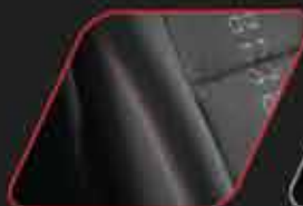
Asientos con doble costura de color rojo