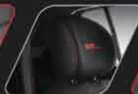
Apoyacabezas delanteros marcados