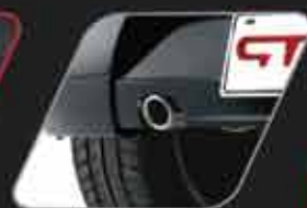
Salida de escape cromada y deportiva