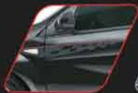
Sticker deportivo en puertas delanteras