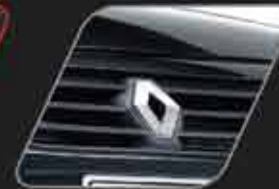
Persiana frontal negra con decorativo tono de carrocería