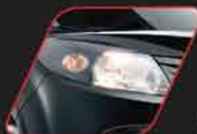
Faros delanteros oscuros