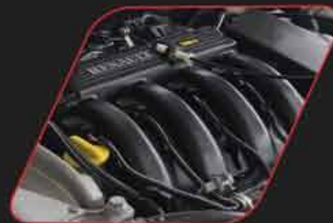
Nuevo Motor 1.6-16 válvulas

Además de su potente motor, el NUEVO Sandero GT Line está lleno de detalles que acentúan su espíritu irreverente y deportivo, tanto en su interior como en el exterior.