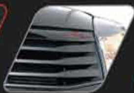
Marcación sobre persiana frontal