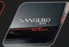
Marcación GT Line en puerta de baúl