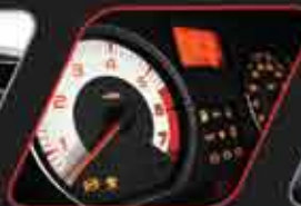
Tablero de instrumentos deportivo