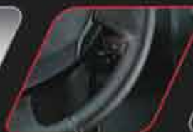
Telecomando satelital de serie bajo el volante