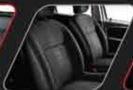
Asientos con estampados en alto relieve