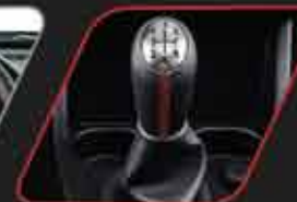
Palanca de velocidades con costura roja