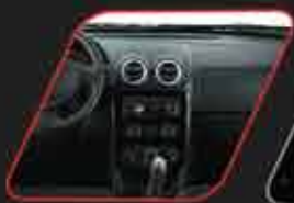
Consola central negra brillante*