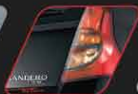
Stop traseros oscuros