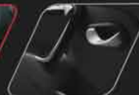
Paneles de puerta negro brillante*