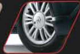
Rines de aluminio con look deportivo