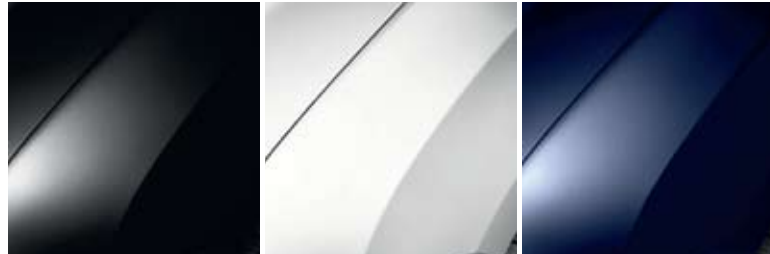
(PEARL BLACK (PC 676) (GLACIER WHITE (CO 369) (NAVY BLUE (CO D42)