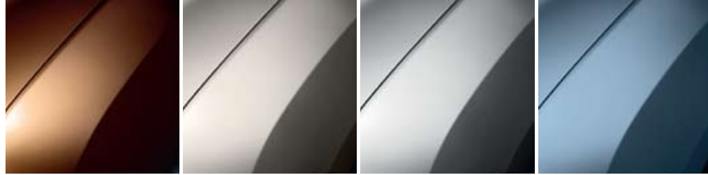
(CASHEW BROWN (SEC CNA) (BASALT GREY (SEC KNM) (PLATINUM (SEC D69) (MINERAL BLUE (SEC RNF)