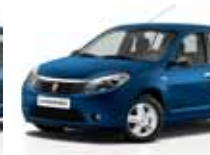
أزرق شديد (RNA) EXTREME BLUE RNA