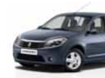
أزرق كهربائي (RNZ) ELECTRIC BLUE RNZ