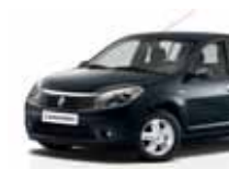
أسود متلألئ 676 (CP)* PEARLESCENT BLACK 676 (CP)*