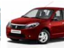
أحمر ناري (B76) FIRE RED B76