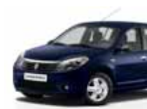
أزرق نيلي (61H) NAVY BLUE 61H