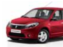
أحمر حار (21D(GO)) PASSION RED 21D(GO)