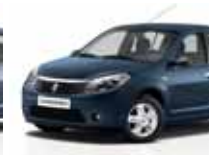
أزرق معدني (RNF) MINERAL BLUE RNF