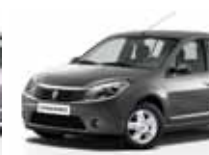
رمادي بازلتي (KNM) BASALT GREY KNM