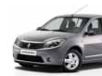
رمادي بلاتيني (D69) PLATINUM GREY D69