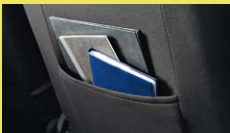
Insteekvakken aan de rugleuning van de voorstoelen (Lauréate).