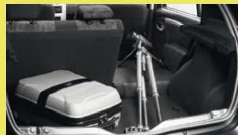
Vanaf de Lauréate uitvoering is de achterbank van de Dacia Sandero 1/3-2/3 neerklapbaar.