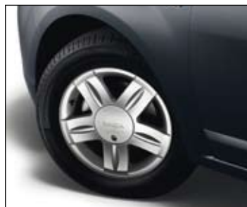
Lichtmetalen wielen 15" 'Alium' (Sandero).