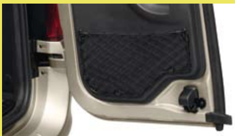
Vanaf de Lauréate uitvoering heeft de Logan MCV een bagagenet aan de rechter achterportier.