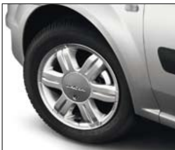
Lichtmetalen wielen 15" 'Bran' (Logan MCV).