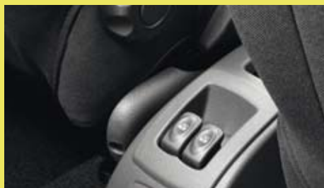
Optioneel zijn de portieruitten achter elektrisch bedienbaar.