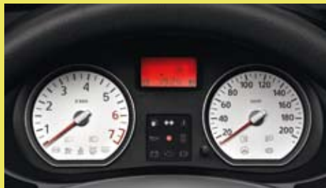
Vanaf de Lauréate uitvoering zijn de wijzerplaten wit.