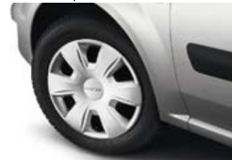
15" Wieldop 'Tisa'.