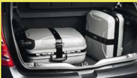
Minimaal 320 liter kofferruimte in de Dacia Sandero.