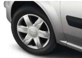
15" Wieldop 'Somes'.