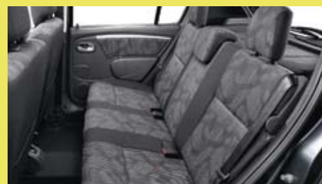
De zitplaatsen achter bieden genoeg ruimte voor drie passagiers.