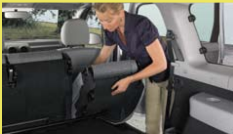
Het interieur van de Dacia Logan MCV is zeer multifunctioneel.