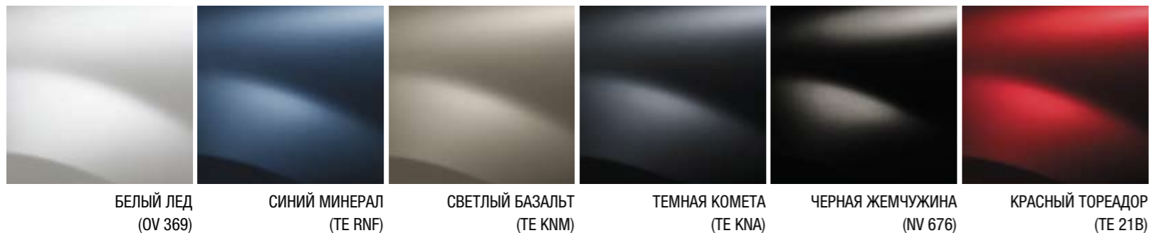
БЕЛЫЙ ЛЕД (OV 369)